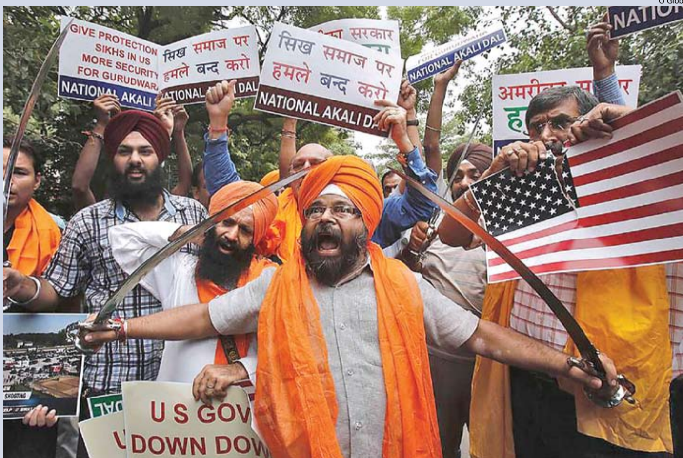
EUA - Agosto de 2012: na foto acima, religiosos protestam após atentado no templo Sikh, em Wisconsin quando homem matou seis pessoas

James Holmes atira durante estréia do filme Batman, em cinema do Colorado, matando 12 pessoas e ferindo mais uma dezena